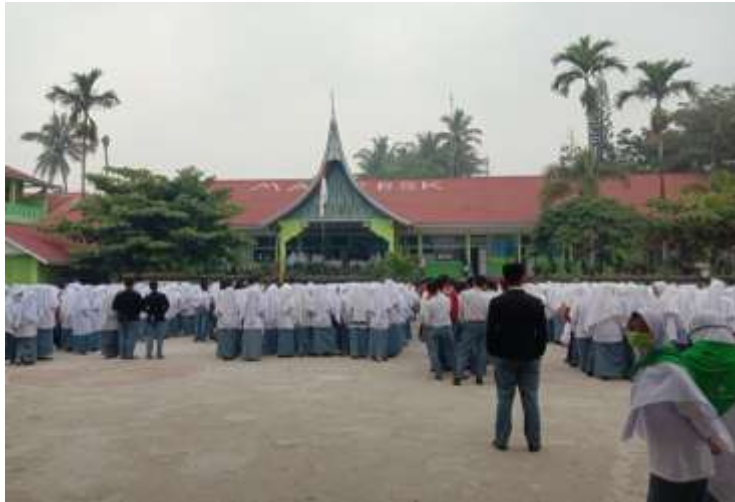
(برنامج المحاضرة في يوم الخميس)