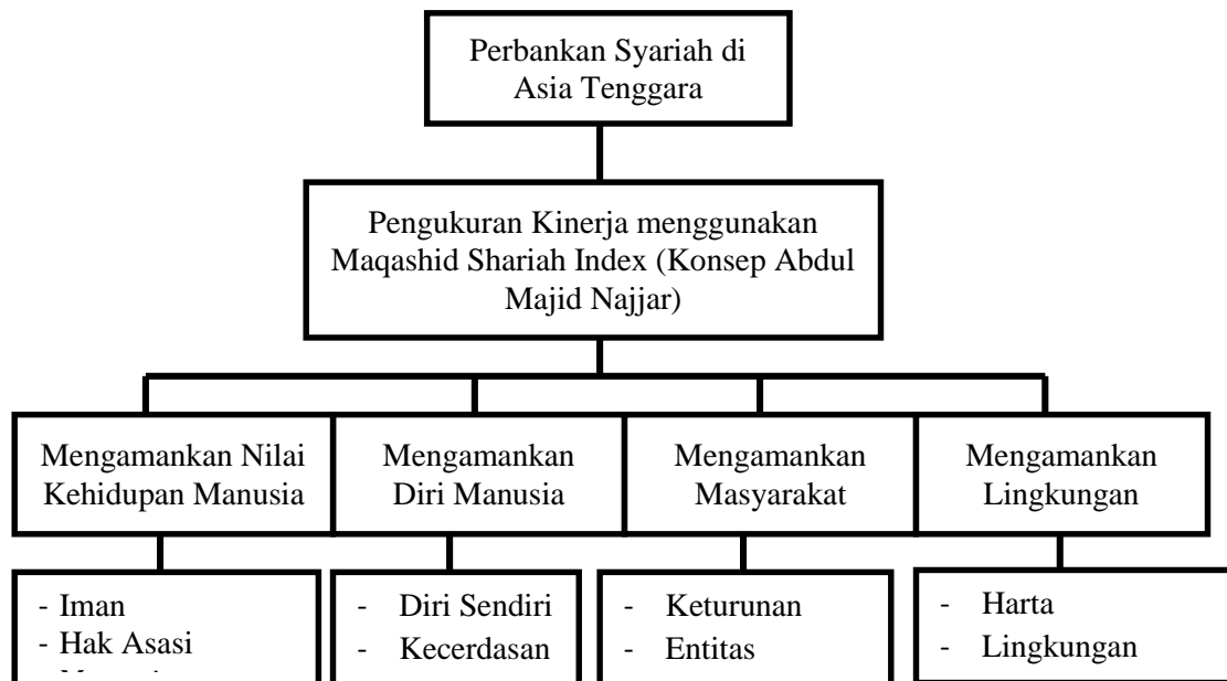
Gambar 1 Skema Kerangka Pemikiran